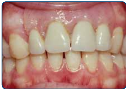
Plaatprothese van voren

De plaatprothese is gemaakt van een roze, tandvleeskleurige kunsthars. Daarin zijn de kunsttanden en -kiezen verankerd. De gehele plaatprothese rust op het slijmvlies van de mond. Deze zit eventueel met ankertjes vast aan overgebleven tanden of kiezen.