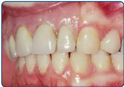
Plaatprothese van opzij