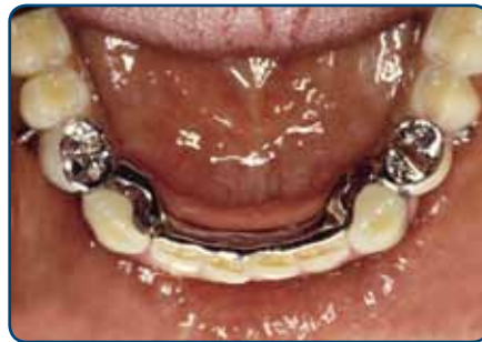
Frameprothese met verankering op kronen