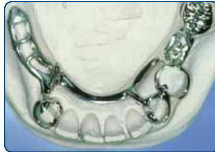
Frameprothese in wording op een gipsmodel, zonder kunsttanden en -kiezen

Bij een slotje wordt de ene kant vastgemaakt aan een kroon, tand of kies en de andere kant zit vast aan de frameprothese. De frameprothese kunt u op die manier in het slotje schuiven. Het slotje zit doorgaans aan de binnenkant van de tanden en kiezen en is dus niet vanaf de buitenkant zichtbaar. Ankertjes zijn vaak wel enigszins zichtbaar.